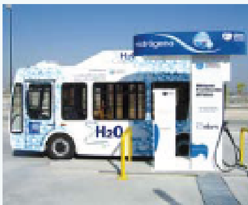
Autobus con pila de combustible (Expo Zaragoza)